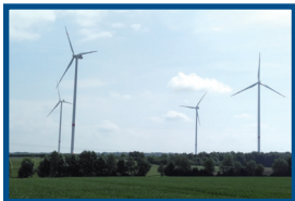
BÜRGERWINDRAD REISLEIN 4X V-112