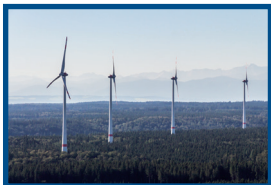
BÜRGERWIND FUCHSTAL 4X E-115

Alle Kontaktdaten schnell und unkompliziert auf Ihrem Smartphone.