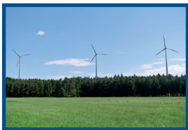
BÜRGERWINDENERGIE DÜRRWANGEN 3X E-82